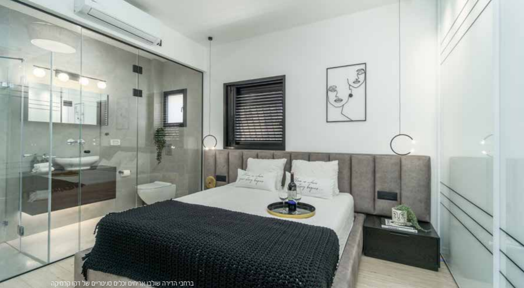
ברחבי הדירה שולבו אריחים וכלים סניטריים של דקו קרמיקה